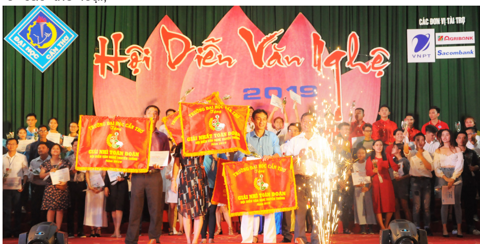
Trao giải Nhất toàn đoàn cho Khoa Luật, giải Nhì toàn đoàn đến Khoa Khoa học Xã hội và Nhân văn, và Khoa Nông nghiệp.

Song song với Hội thao truyền thống, Hội diễn Văn nghệ truyền thống Trường ĐHCT lần thứ 39 cũng là cơ hội để các đơn vị gặp gỡ, giao lưu và học hỏi, thắt chặt thêm tình đoàn kết với nhau. Thành công của Hội thao và Hội diễn năm 2019 đã giúp cho Trường ĐHCT không chỉ có được một nguồn nhân lực dồi dào, bổ sung vào lực lượng văn nghệ và thể dục thể thao mà còn thêm tự hào vì có những thế hệ sinh viên năng động, sáng tạo.