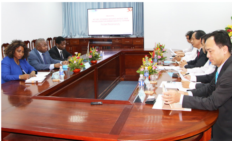
Hai bên trao đổi tại buổi gặp gỡ.

Trong không khí gần gũi, ấm áp, Đại sứ Mozambique bày tỏ sự cảm kích đối với buổi tiếp đón nồng hậu và lòng mến khách từ Trường ĐHCT. Đại sứ đánh giá cao vai trò quan trọng của Trường ĐHCT trong giáo dục, đào tạo nguồn nhân lực cho vùng ĐBSCL trong thời kỳ hội nhập nền kinh tế thế giới. Đại sứ cũng đánh giá rất cao mối quan hệ hợp tác đang trên đà phát triển giữa Việt Nam và Mozambique. Ngài chia sẻ với điều kiện thổ nhưỡng ở Mozambique khá giống với ĐBSCL, bên cạnh đó, Trường ĐHCT là trường hàng đầu trong lĩnh vực nông nghiệp ở Việt Nam, với vai trò là Đại sứ vừa nhận nhiệm