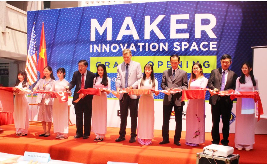
Các đại biểu cùng cắt băng khánh thành Không gian sáng chế - Đại học Cần Thơ.