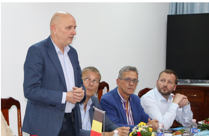
Ông Georges Dallemagne, thành viên Nghị viện Bỉ, Trưởng đoàn, phát biểu tại buổi gặp gỡ.

quan, thế mạnh và những hoạt động nổi bật của Trường ĐHCT trong hoạt động hợp tác quốc tế. Đại diện đoàn Nghị viện và Đại sứ quán Bỉ cũng đã gửi lời cảm ơn đến buổi tiếp đón nồng nhiệt từ Trường ĐHCT và bày tỏ mong muốn tìm hiểu về các hoạt động của Trường, những thách thức đang đặt ra đối với vùng ĐBSCL, tình hình biến đổi khí hậu ảnh hưởng đến canh tác nông nghiệp hay sự thiếu hụt nguồn nước ngọt, bên cạnh các chương trình hợp tác về đào tạo sau đại học với các đối tác Bỉ.