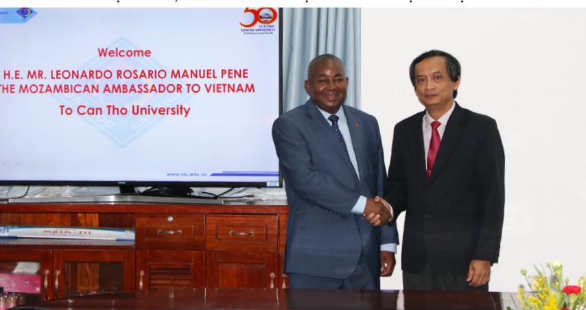
Kết quả tốt đẹp từ chuyến thăm của Đại sứ Mozambique đến Trường ĐHCT hứa hẹn mở ra nhiều cơ hội hợp tác phát triển cho cả hai bên.